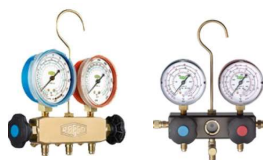
เกจชุดวัดความดัน