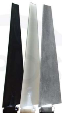
PAG PPE ALUMINUM